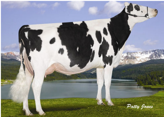
ROCKYMOUNTAIN SUPER LEITA Dam